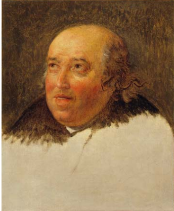
© Musée des Beaux-Arts et d'Archéologie de Besançon