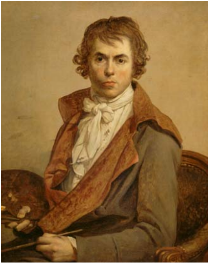
Portrait de l'artiste Jacques-Louis David