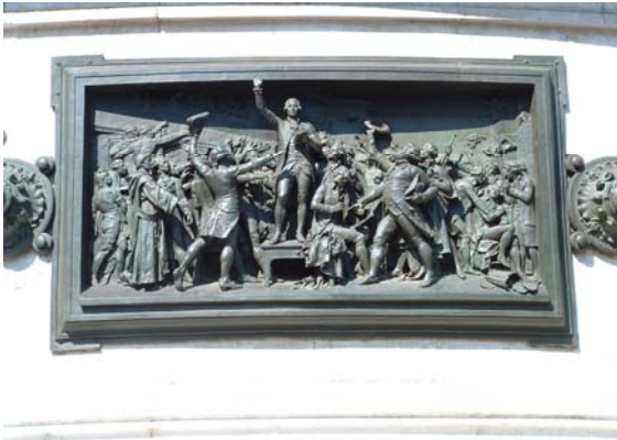
Bas-relief en bronze du monument à la République Place de la République à Paris

Léopold Morice obtient une commande de la Ville de Paris en 1880, à l'issue d'un concours organisé en 1789 pour la réalisation de la première statue monumentale symbolisant la République.