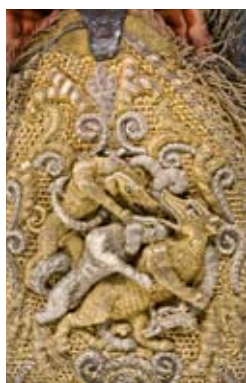
Baudrier avec motif d'animal (détail), milieu du XVII e siècle

LE CENTRE DE RECHERCHE DU CHÂTEAU DE VERSAILLES organise un colloque international, dans le cadre du programme de recherche « Se vêtir à la Cour : typologie, usages et économie », sur les cultures matérielles et visuelles du costume dans les cours européennes (1300-1815).