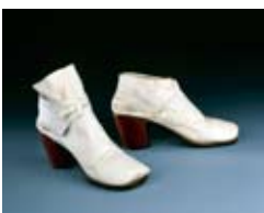
Paire de chaussures d'homme, fin du XVII e – début du XVIII e siècle

CES LUXUEUSES CHAUSSURES D'HOMME sont des témoignages extraordinaires de la mode de chaussures blanches à talon rouges portées à la cour de Louis XIV. Ce type de chaussures, décorées de grands noeuds, de broches et de boucles, était destiné à être porté à la cour par un souverain ou un courtisan. Elles étaient considérées comme le signe d'une élégance particulière. Hyacinthe Rigaud les met particulièrement en valeur dans son grand portrait de Louis XIV en costume royal daté de 1701. Les fameux talons rouges apparaissent à la cour de France vers 1670. Ils furent portés jusqu'à la fin du XVIII e siècle par les souverains d'Europe.