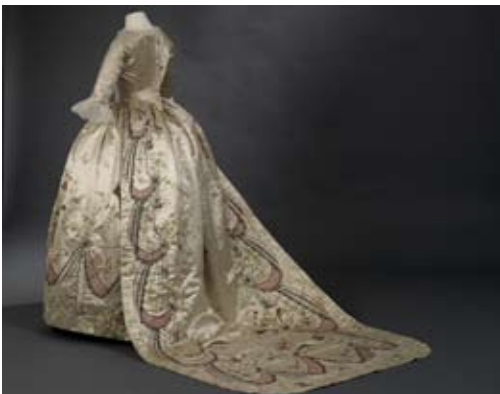
Robe parée : robe et jupe, 1780-1790

LES ROBES DITES « PARÉES » étaient très à la mode dans les années 1780-1785 et se prêtaient à merveille aux talents des marchandes de modes.