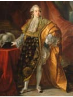
Le Comte d'Artois en grand habit de l'ordre du Saint-Esprit, Antoine-François Callet (1741-1823), quatrième quart du XVIII e siècle

CETTE ŒUVRE REPRÉSENTE le frère de Louis XVI qui porte le grand manteau décoré de flammes de l'ordre du Saint-Esprit, doublé de satin de soie orangé. Ce grand tableau a été commandé par le prince pour la cour des aides d'Abbeville, il avait la volonté d'y apparaître en majesté.