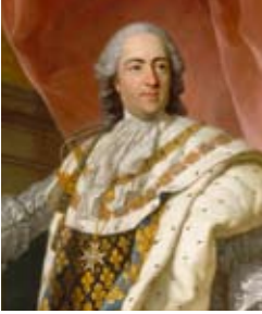
Louis XV (1710-1774), roi de France et de Navarre, en grand manteau royal en 1760, par Jean Martial Fredou (1710-1795), d'après Van Loo Louis-Michel (1707-1771), 1763, Versailles, château de Versailles

LOUIS MICHEL VAN LOO reçoit en 1759 la commande d'un portrait de Louis XV en costume royal, portant les insignes du sacre. Van Loo succède à Hyacinthe Rigaud, qui avait codifié le genre. Exposée au Salon en 1761, l'œuvre emporta l'adhésion du public et de la critique.