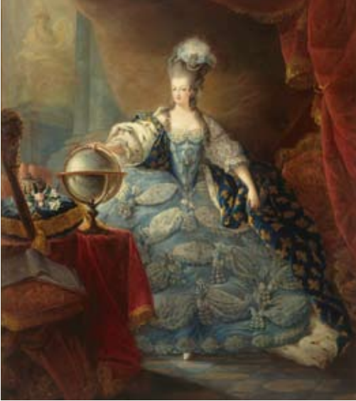
Marie-Antoinette en grand habit de cour, par Jean-Baptiste André Gautier-Dagoty (1740-1786), 1775 Versailles, château de Versailles

MARIE-ANTOINETTE EST VUE EN PIED , la main droite appuyée sur une mappemonde. Son grand habit de cour se compose d'un grand corps baleiné largement décolleté en ovale, se terminant en pointe, d'une jupe de soie sur très grands paniers, ornée de bouillonnés de gaze rayée et ponctuée de glands de passementerie. Elle porte enfin un manteau de cour fleurdelisé doublé d'hermine. Sur les cheveux bien relevés est posé un pouf de velours, surmonté d'un bouquet de grandes plumes blanches fixé par une aigrette de diamants.