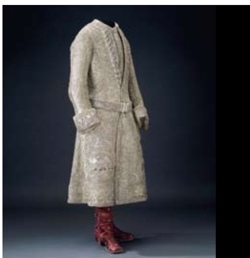
Habit de couronnement de Gustave III, 29 mai 1772

Habit de couronnement de roi Gustave III de Suède (1746-1792), le 29 mai 1772