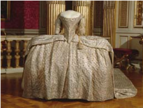
Robe de cour (grand habit) portée pour le couronnement de Sophie Madeleine, le 29 mai 1772

BIEN QUE SUÉDOISE , la robe de couronnement en drap d'argent façonné de la princesse Sophie Madeleine est un grand habit comme ceux que les reines de France portent à la cour. Il est constitué des trois pièces essentielles, amovibles : le grand corps ou corps de robe, la jupe sur un immense panier – ici de près de deux mètres, et le bas de robe ou queue, c'est-à-dire une traîne, longue de cinq mètres et attachée à la taille par des agrafes d'argent.